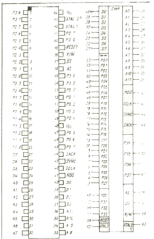
Anschlußbelegung und Schaltzeichen Bauform: QUIP-64, Plast (Bild 16)